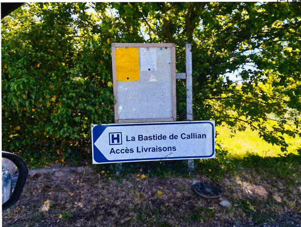
Chemin de la Fontaine / Chemin des Mourgues :