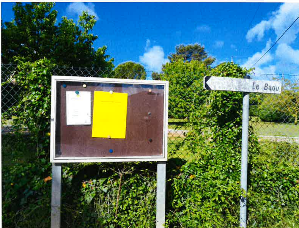
Chemin des Combes / Chemin de Dayan: