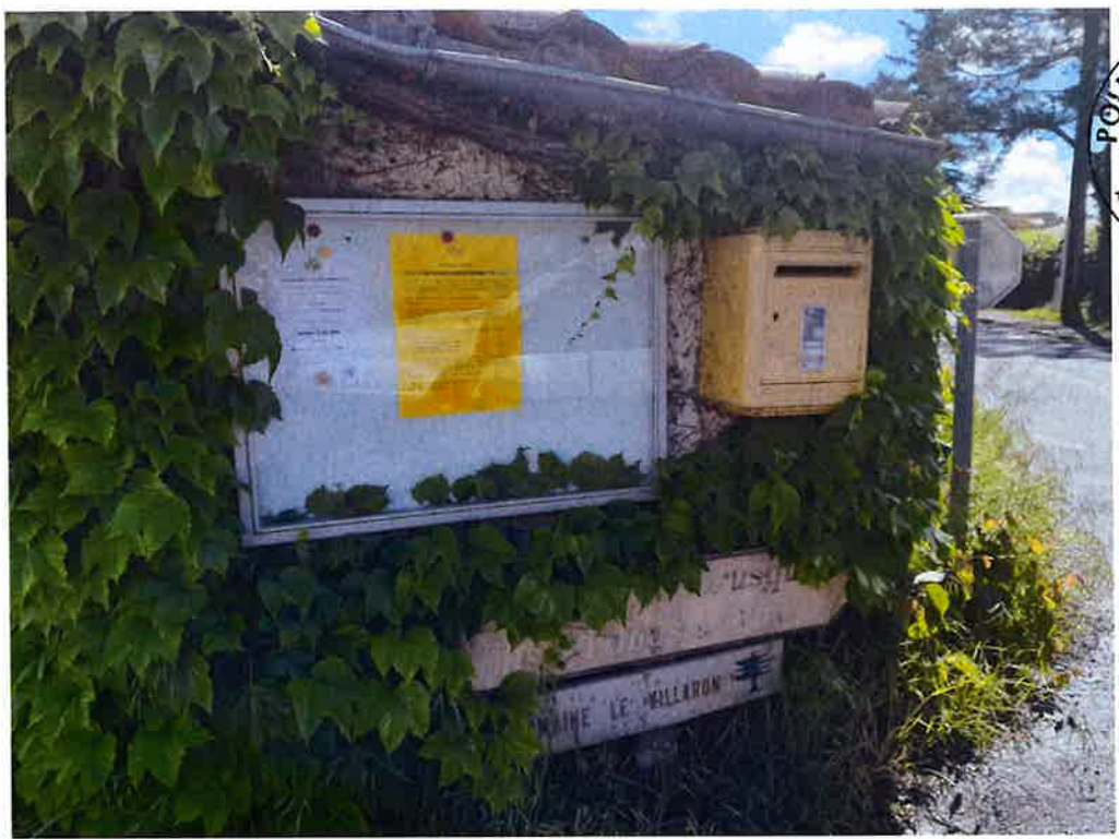
Route de Saint Cézaire / Chemin des Touars :