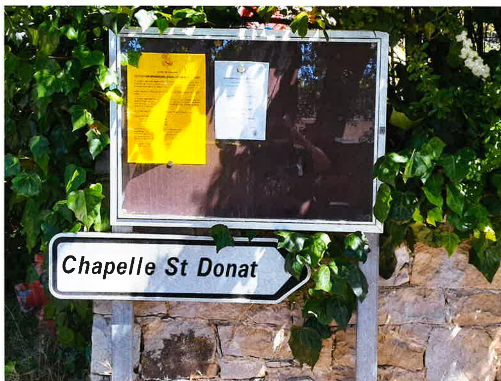
Face au 431, Chemin du Vignaou: