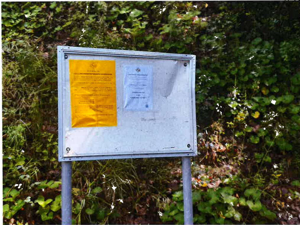
Chemin des Hautes cottes / Chemin du Purgatory: I