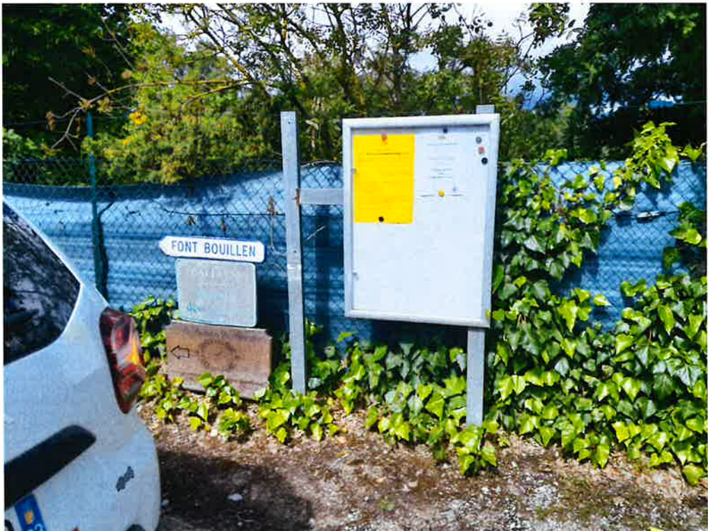
Chemin des Graous / Chemins des Bruyères :