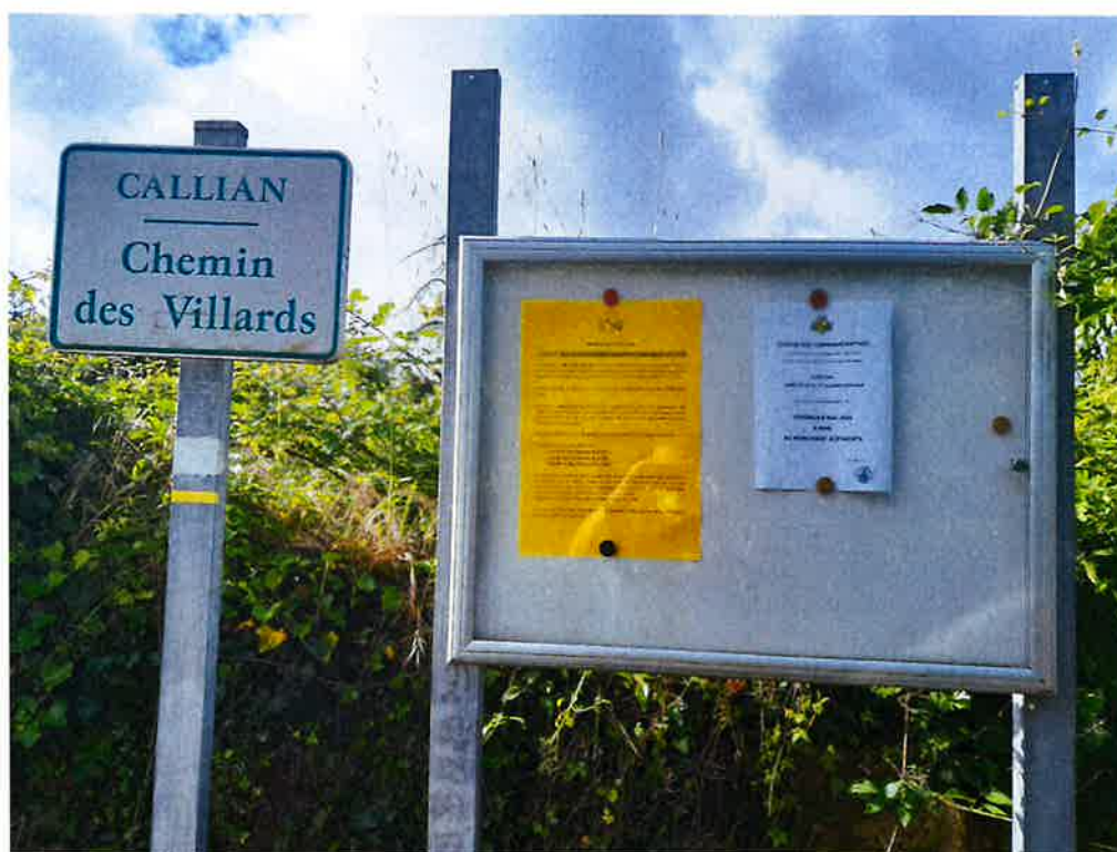
Face au 1197, Chemin des Villards :