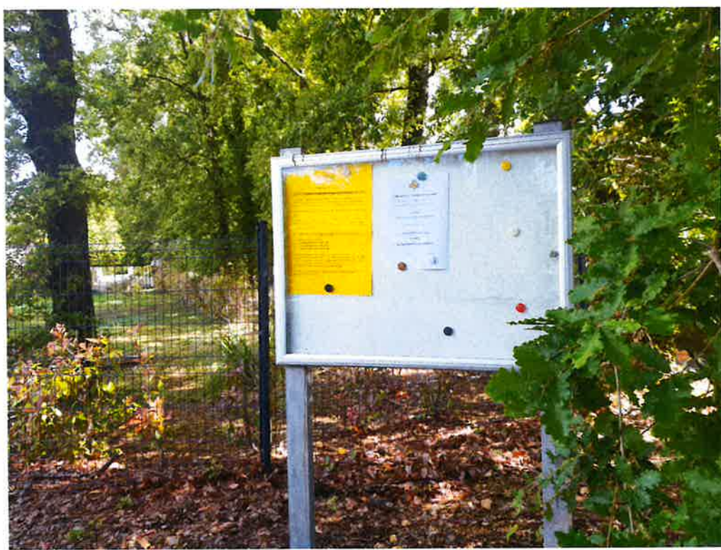
Chemin des Touars / Chemin des Adrechs : I