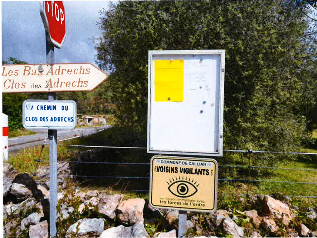
Route de Mons / Chemin du Clos des Adrechs :