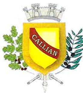
PLANCHE PHOTOGRAPHIQUE Nombre de photo(s) : 13 Nature des faits : Photos des tableaux administratifs dont l'enquête publique AR 2026-05/03 du 05/05/2026 83440 CALLIAN FRANCE