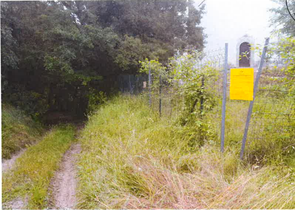
Chemin de Saint Donat :