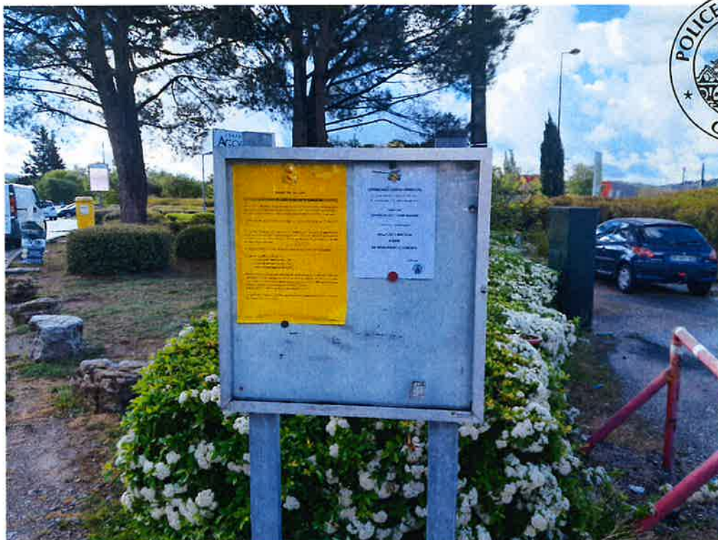
Centre de l'Agora face au salon de coiffure « Capill'hair »: