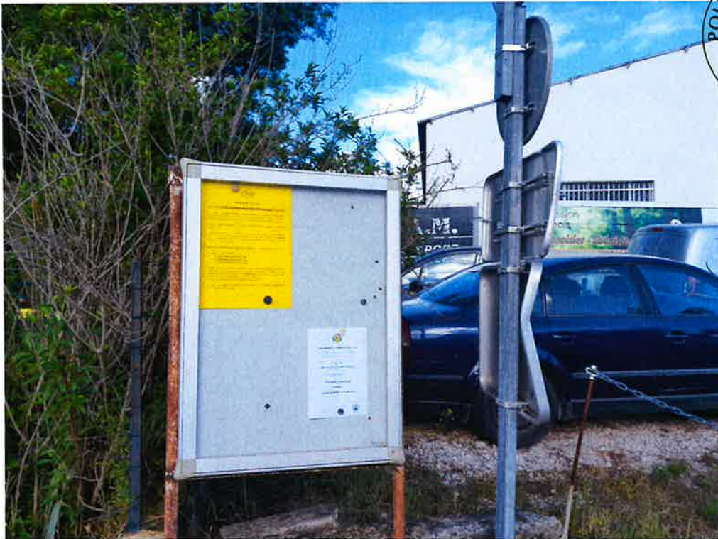
Au niveau du garage Renault, Chemin des Maures: