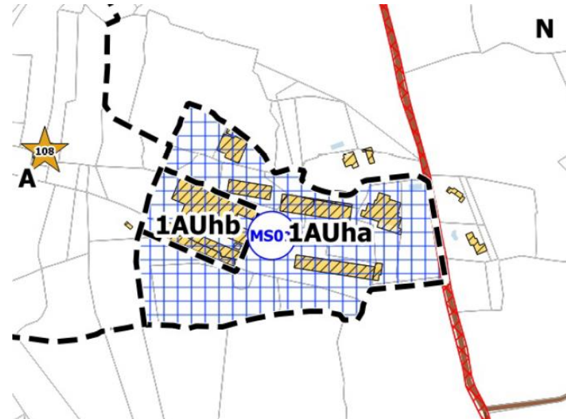
Zone 1AU de Touos Aussel du PLU

Il est classé en zone 1AU selon le PLU en vigueur et correspond à l'ancienne ferme avicole de la route de Mons. La zone 1AU actuelle limite strictement les constructions à celles déjà édifiées. La future opération ne devrait pas autoriser de nouveaux défrichements.